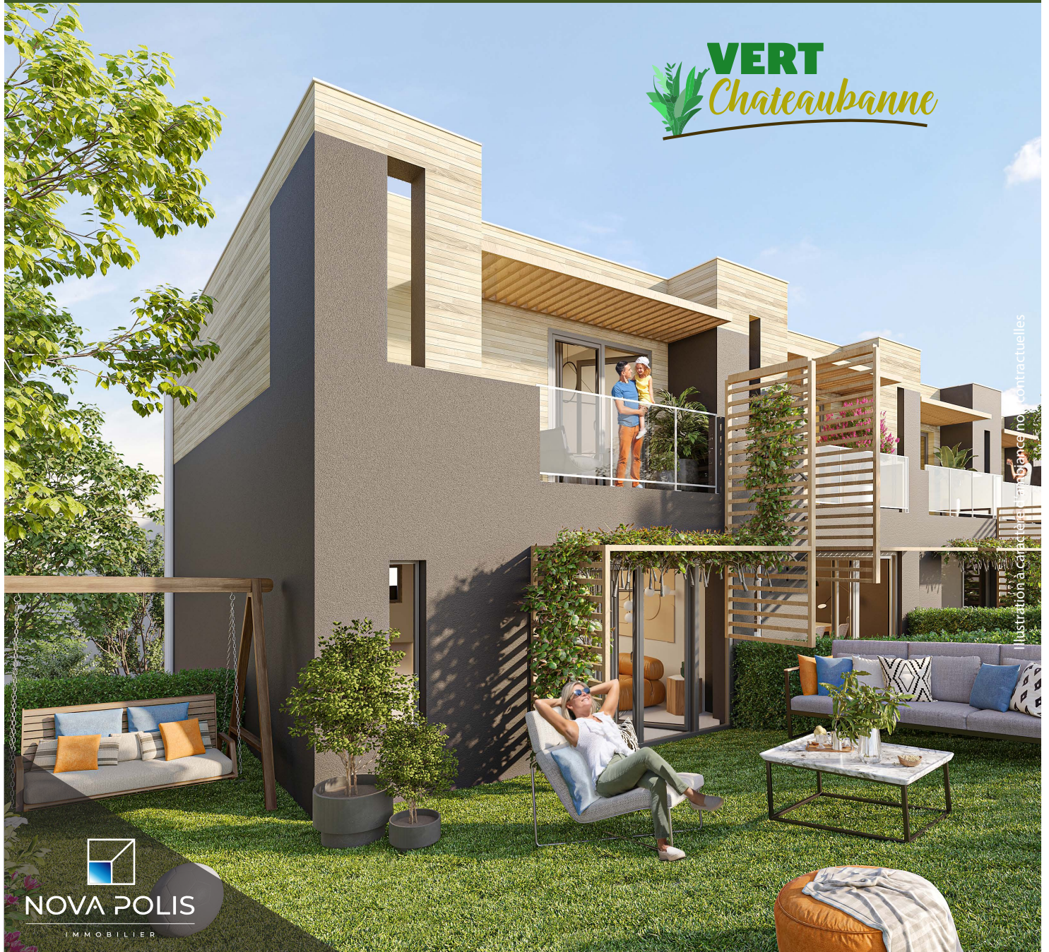
Illustration à caractère environnemental contractuelles