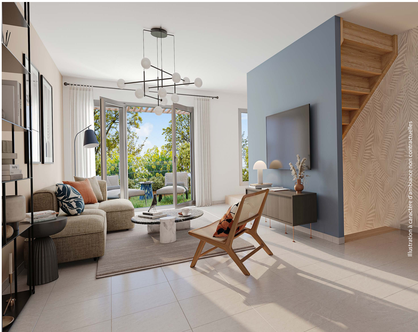
Illustration à caractère d'ambiance non contractuelles